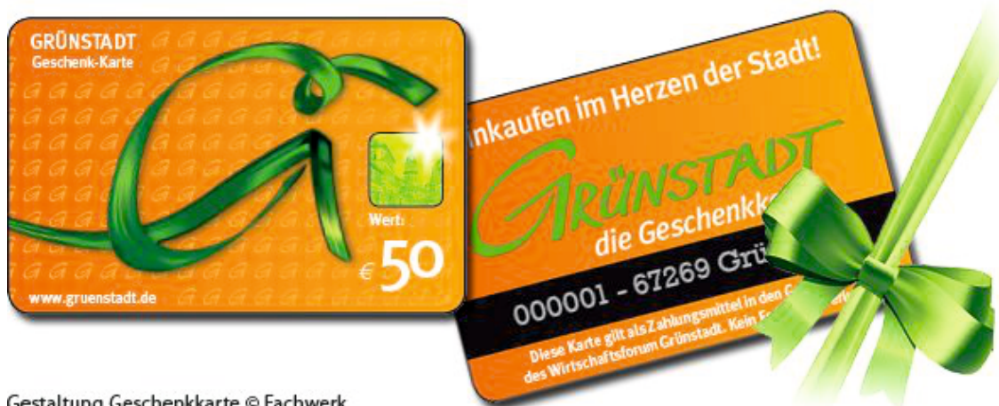
Gestaltung Geschenkkarte © Fachwerk

Das Wirtschafts-Forum bietet wunderschön gestaltete Gutscheine zum Verschenken bei verschiedenen Anlässen an.